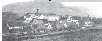
Margrethausen um 1910

Förderverein Kloster Margrethausen e.V., Dorfstr. 28, 72459 Albstadt